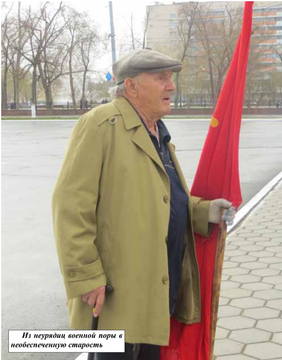
Из неурядиц военной поры в необеспеченную старость