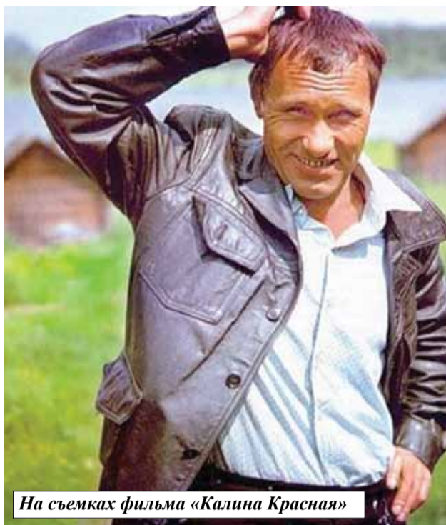
На съемках фильма «Калина Красная»

1958 год стал для него одним из счастливейших. Он успешно закончил четвертый курс и приехал на режиссерскую практику в Одессу, где Марлен Хуциев начинал съемки художественного фильма «Два Фёдора». Это была история о том, как возвращавшийся с войны молодой солдат подобрал бездомного мальчонку и заменил ему отца. Долго искали исполнителя главной роли, пока А.Тарковский не посоветовал попробовать В.Шукшина, его и переодеть не надо было: ходил на практике всё в той же гимнастерке. Первой своей ролью в кино Шукшин показал, какой удивительной непосредственностью и глубиной постижения характера он обладал. В дальнейшем, играя во многих фильмах, он даже в коротком эпизоде был настолько органичен, что сразу возникало полнейшее доверие к его герою.