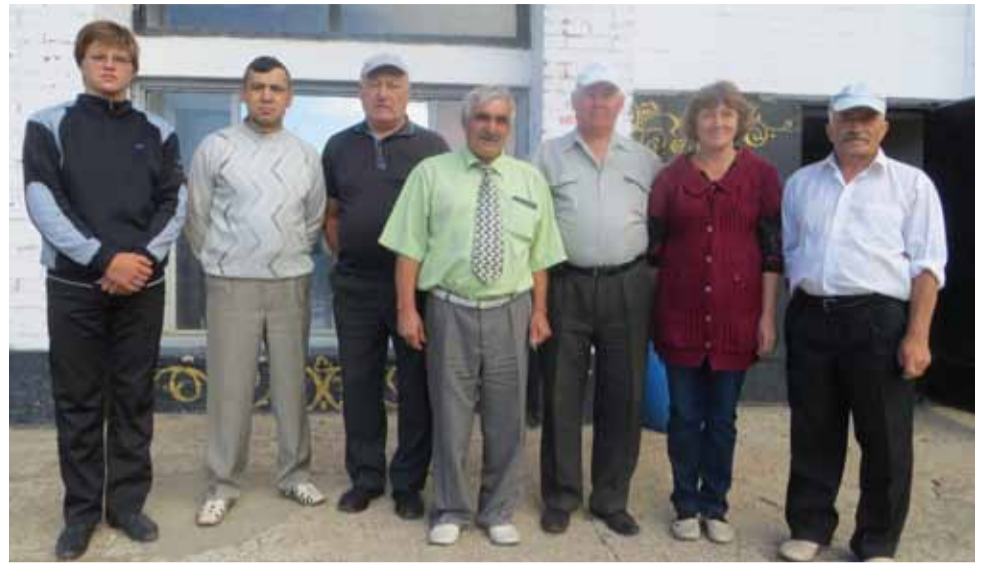
С семинара руководителей местных отделений КПРФ, КРК и общественных организаций Центрального округа области

Интересным опытом привлечения в КПРФ молодежи через спортивные состязания, проводимые по инициативе коммунистов, поделился с трибуны первый секретарь Первомайского райкома