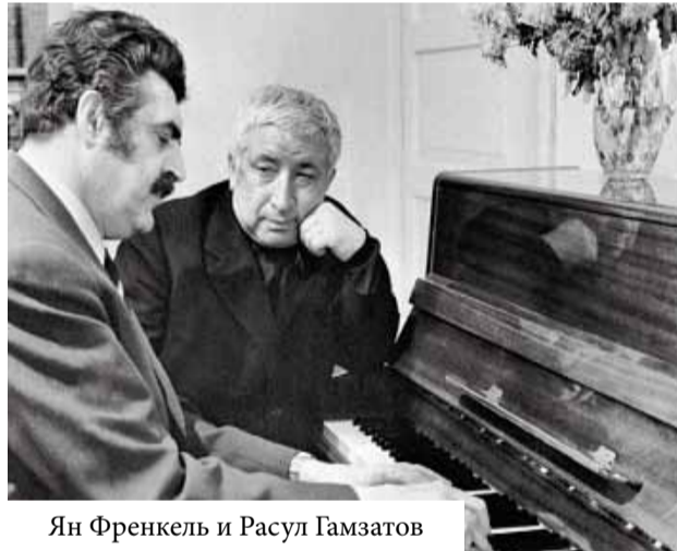
Ян Френкель и Расул Гамзатов

В таком виде стихотворение, переведенное на русский язык Наумом Гребневым, появилось в журнале «Новый мир». На него обратил внимание замечательный актер и певец Марк Бернес, который сразу же усмотрел в стихах будущую песню. И это было немудрено, потому что многие строки Гамзатова к тому времени