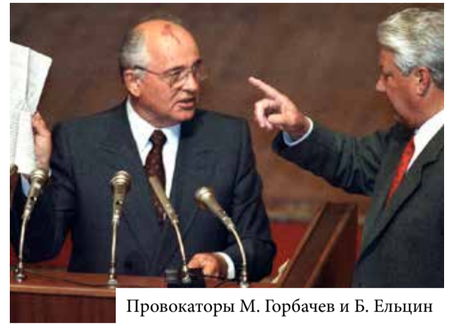
Провокаторы М. Горбачев и Б. Ельцин

В отличие от руководства Украины, занявшего выжидательную позицию и не осудившего, по существу, путчистов вплоть до 20 августа, оппозиция высказалась предельно четко и недвусмысленно в поддержку России. Так что не совсем ясно, кто находится в оппозиции к народу Украины. Как, впрочем, и в глубинах России, где сторонники хунты пустили слишком глубокие корни, которые выкорчевывать будет не так-то просто. Случайно бросаю взгляд на оперативную карту РСФСР. Уже, пожалуй, более 70% областей и городов России заявили о своей безусловной поддержке законного правительства РСФСР. Оренбургской по-прежнему среди этих областей не видно. Впрочем, стоит ли удивляться, зная, кто стоит,