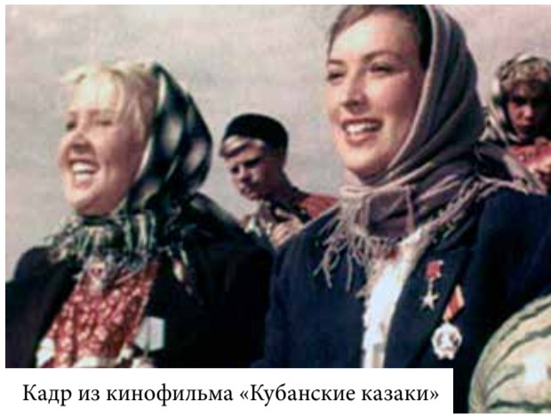
Кадр из кинофильма «Кубанские казаки»

Для наших любознательных детских душ волшебный луч киноаппарата был настоящим чудом. И здесь нужно