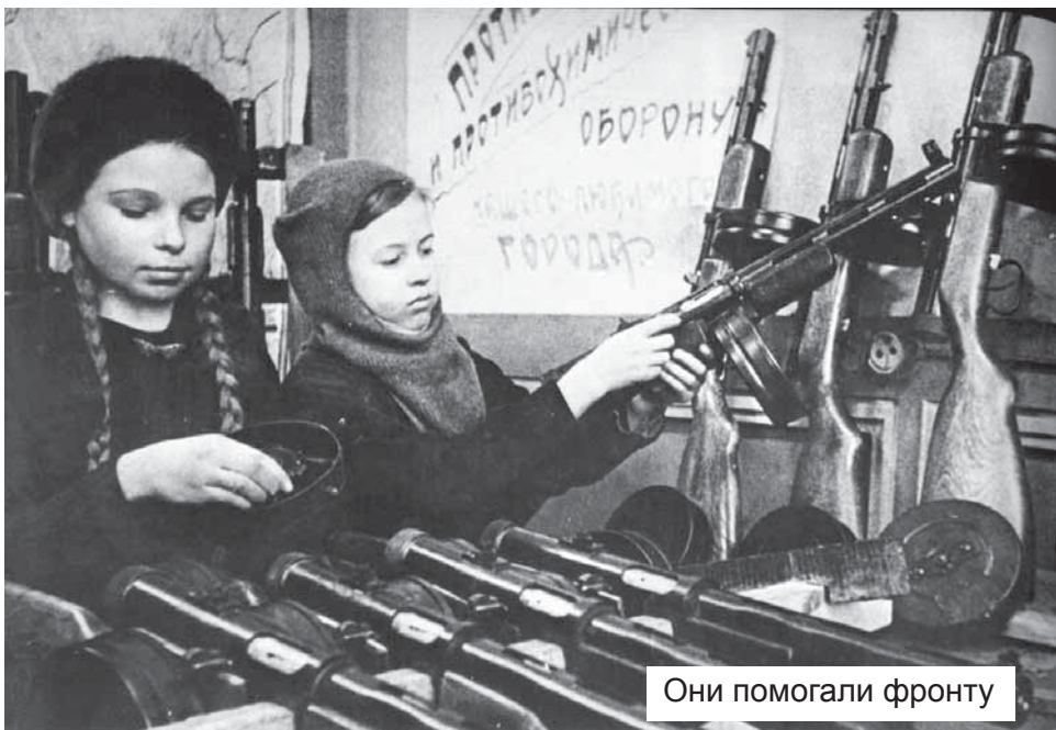
Они помогли фронту