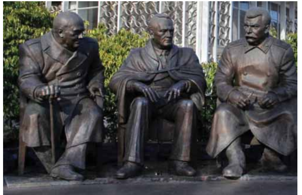
5 февраля в день 70-летия Крымской конференции в Ялте открыт памятник руководителям государств-союзников антигитлеровской коалиции Черчиллю, Рузвельту и Сталину. Автор памятника З.Церетели.

Сила Красной Армии состоит, прежде всего в том, что она ведет не захватническую, не империалистическую войну, а войну Отечественную, освободительную, справедливую. Задача Красной Армии состоит в том, чтобы освободить от немецких захватчиков нашу советскую территорию, освободить от гнета немецких захватчиков граждан наших сел и городов, которые были свободны и жили по-человечески до войны, а теперь угнетены и страдают от грабежей, разорения и голода, освободить, наконец, наших женщин от того позора и поругания, которым подвергают их немецко-фашистские изверги. Что может быть благороднее и возвышеннее такой задачи? Ни один немецкий солдат не может сказать, что он