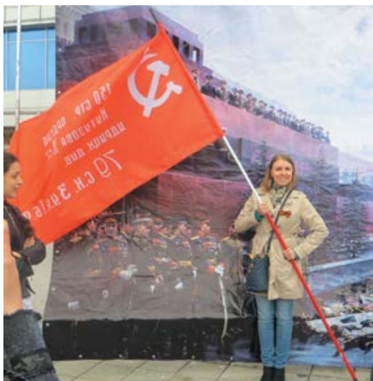
9 мая в Оренбурге у комсомольского макета Красной Площади

1961 г. За беспримерный героический подвиг в освоении космоса в Книгу почета областной комсомольской организации занесен воспитанник Оренбургского авиационного училища, первый советский космонавт Гагарин Юрий Алексеевич.