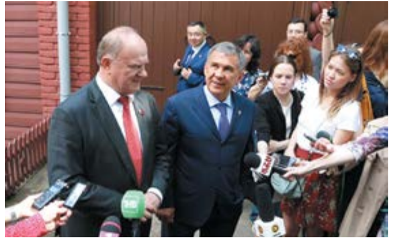
Председатель ЦК КПРФ Г.А. Зюганов и врио президента Республики Татарстан Р.Н. Минниханов

В этих условиях КПРФ продолжает наращивать свой потенциал. Накануне Дня пионерии состоялась грандиозная акция