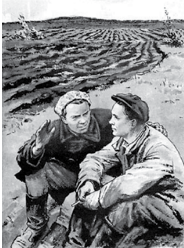
Иллюстрация к роману «Поднятая целина». Секретарь райкома Нестеренко и Давыдов.

Проблеме создания крупнотоварного производства, пробуждения у крестьянина чувства хозяина страны и посвятил Михаил Александрович Шолохов свой роман «Поднятая целина».