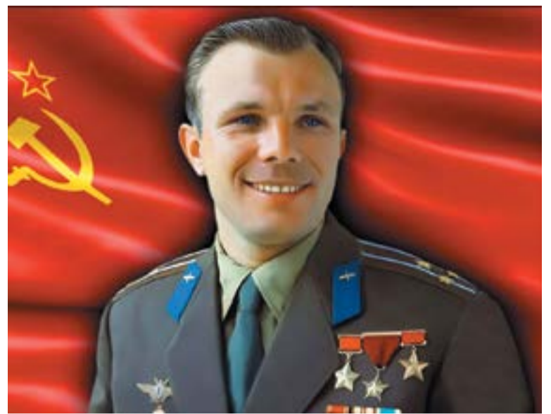
Комсомолец Юрий Гагарин

1954 г. Состоявшийся в феврале-марте 1954 года февральско-мартовский пленум ЦК КПСС принял историческое постановление «О дальнейшем увеличении производства зерна в стране и об освоении целинных и залежных земель». Пар-