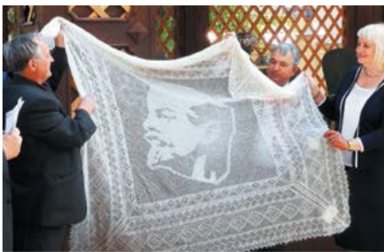
Оренбургская делегация подарила Дому-музею В.И. Ленина пуховый платок с изображением Ильича