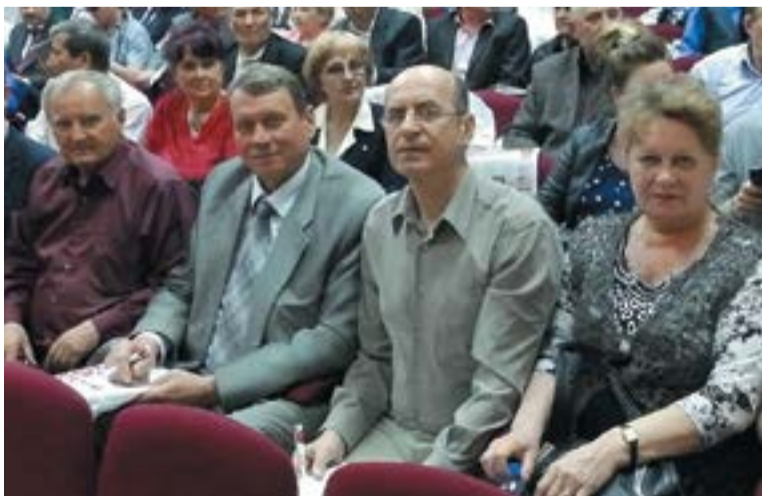
Делегация оренбургских коммунистов в зале семинара-совещания