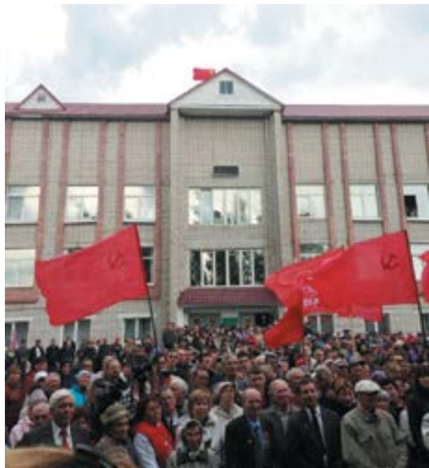
Митинг коммунистов в совхозе «Звениговский»

Нас хотели соблазнить частной собственностью и разединить – с каждым поодиночке ведь легче справиться. Я даже в советское время выступал против мелких колхозов. Призывал создавать крупные хозяйства с мощным производством, большие поселки – агрогородки. В них всё для отличной работы и содержательного быта – школа, дом культуры, больница и многое другое. Нам ни к чему было отказываться от этого и откатываться назад. Поэтому всем миром решили сохранить и дальше развивать совхоз как коллективное хозяйство на основе общественной собственности. По законам социализма.