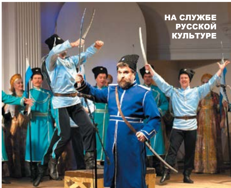
НА СЛУЖБЕ РУССКОЙ КУЛЬТУРЕ

Самобытны и танцы. Это и лирический хоровод «Летел голубь», хоровод с оренбургскими платками «Пуховницы», хореографическая картинка «На свида-