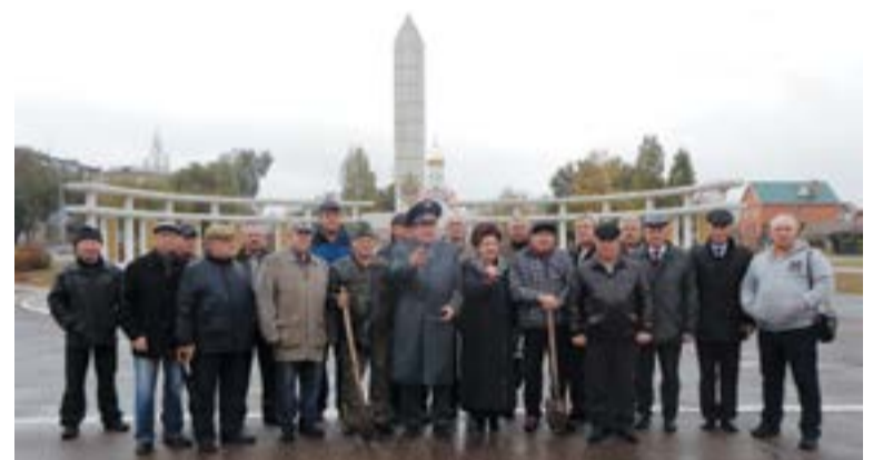
На снимке: Участники субботника