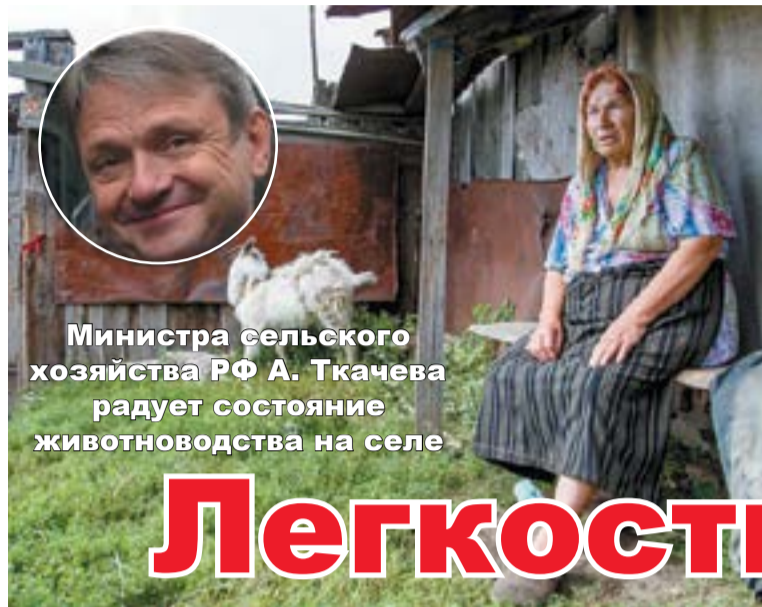
Министра сельского хозяйства РФ А. Ткачева радует состояние животноводства на селе

Зато с началом капиталистических «реформ» заброшено и заросло чертополохом до 43 миллионов гектаров, и лишь в последние годы статистика чуть улучшена. В Оренбургской области предали одичанию и запустению около 2 миллионов гектаров полей – больше, чем было поднято целинных земель.