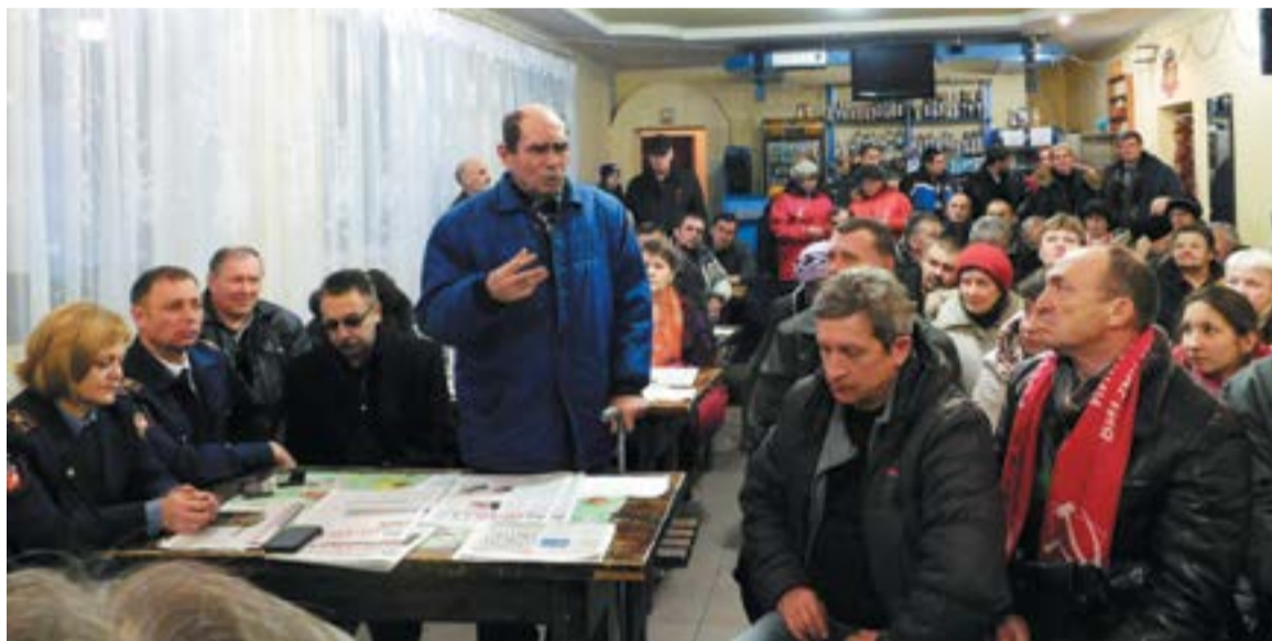
Яблоку негде было упасть

Участники слушаний выразили надежду, что власти одумаются и примут разумные решения о выделении необходимых средств для ликвидации опасных скважин, о запрещении добычи нефти в бору, а также проявят решимость в борьбе за бор под Бузулуком.