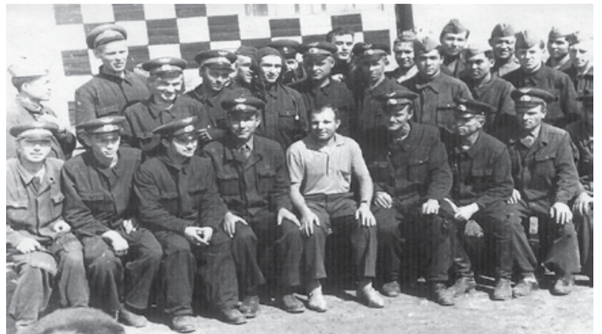
Ю.А. Гагарин на полевом аэродроме в Оренбуржье. Третий слева от космонавта С.И. Зырянов, ныне один из самых активных коммунистов Центрального местного отделения КПРФ (г. Оренбург)

Большинство россиян (77%) считает, что в стране экономический кризис, не согласны с этим мнением 17% участников опроса, проведенного «Левада-центром» (сентябрь, 46 регионов, 1600 опрошенных).