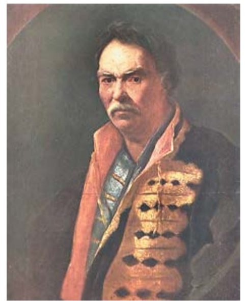
И. Никитин. Портрет наполеоновского гетмана.

Подлинную историческую канву событий они, что называется, ломают через колено. Все родовитые герои этой картины, даже Петр III, убитый братьями Орловыми в угоду Екатерине, сверхблагородны. Один лишь народ – дик и злобен, которым можно управлять только с помощью водки. Любовник Елизаветы Петровны Алексей Разумовский по фильму человек с утонченными нервами. Его брата Екатерина сделала гетманом Украины. Сохранился портрет одного такого гетмана екатеринских времен. Он могуч. На его теле шитый золотом камзол кажется лишним, просто тряпкой. А сильная голова по-бычьей выставлена вперед – этакий соратник Тараса Бульбы, когда казачья вольница, воюя с алчным польским панством, и костелы жгла, а бывало, и с мирным населением расправлялась. От этих Разумовских и к Оренбургу ниточка протягивается. У гетмана Разумовского, которому Екатерина II подарила 37 тысяч крепостных, был сын Алексей, который женился на самой богатой невесте тогдашней России Наталье Шереметьевой. Но жить с нею не стал – жил в подмосковной деревне Перово с мещанкой