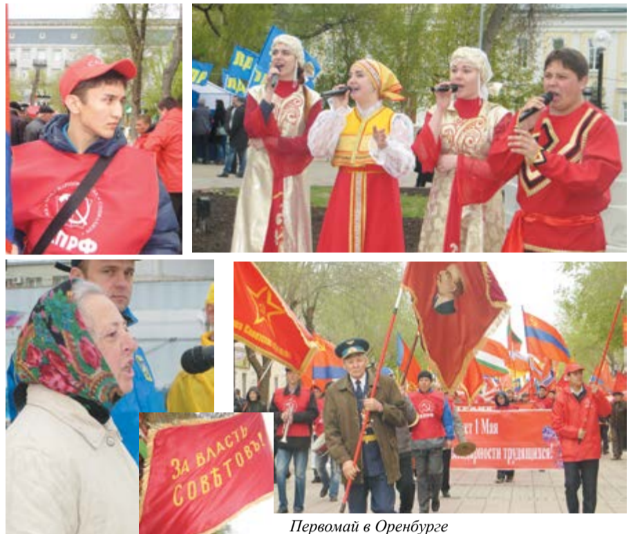
Первомай в Оренбурге

Сегодня мы публикуем резолюции разгневанных оренбуржцев, принятые на первомайском митинге и митинге 28 апреля в сквере перед зданием областной администрации, где в тот день заседали депутаты Законодательного Собрания области. Увы! Из руководящих лиц законодательной и исполнительной власти к митингующим никто не вышел. Бояться или пренебрегают? Поживем – увидим!