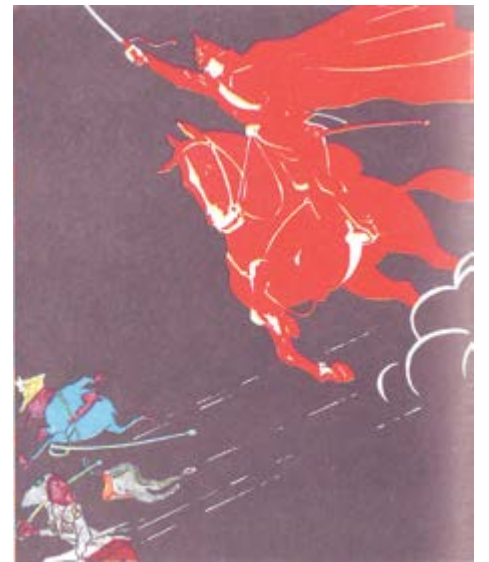
Иллюстрация к поэме В. Маяковского «Хорошо!». Автор Н. Долгоруков. 1958 г.

Ниже мы публикуем отрывок из статьи поэта, лауреата Ленинской премии за книгу «День России» Ярослава Смелякова, рассказывающего о гибели