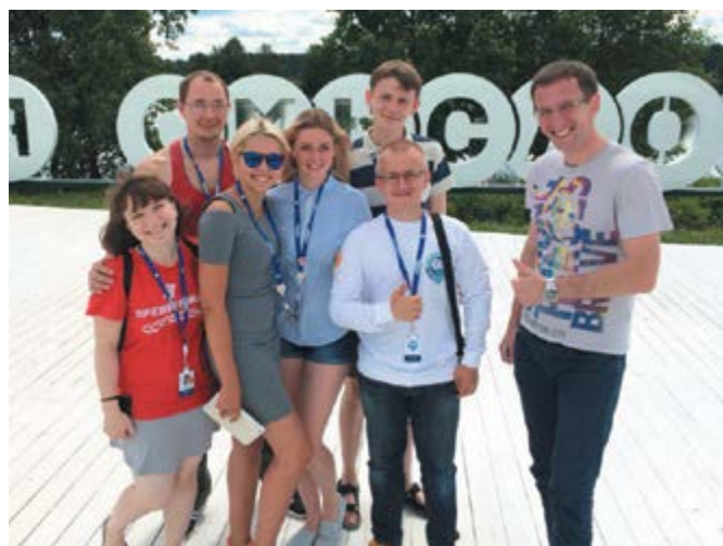
Делегация оренбургских молодежных организаций

Я был в их числе, так как сама смена называлась «молодежные депутаты и политические лидеры». В ходе смены участники форума готовили свои предложения для формирования государственной программы «Молодежь России».