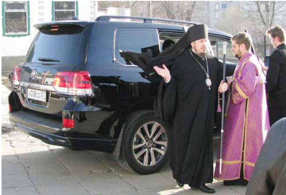
Епископ Ливенский и Малоархангельский Нектарий.

Орловский епископ обзавелся Land Cruiser за шесть миллионов рублей