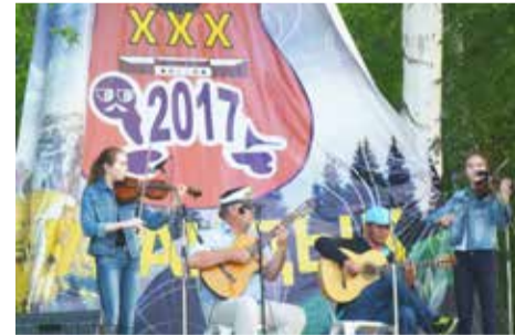
Исполнители на сцене