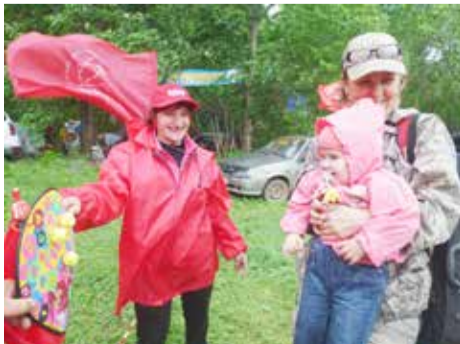
Самый юный участник