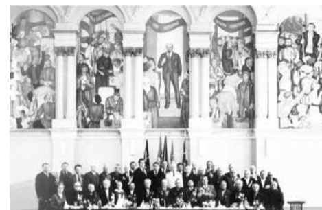
Фреска с здания оренбургского горсовета. Апрель 1979 года.

значит признаваться в собственном невежестве, уподобляться «Иванам, родства не помнящим».