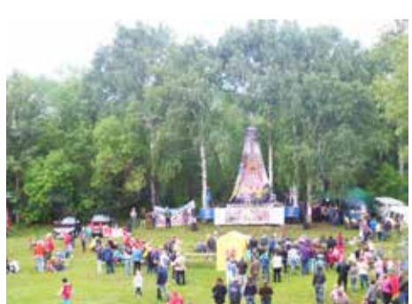
На поляне песен