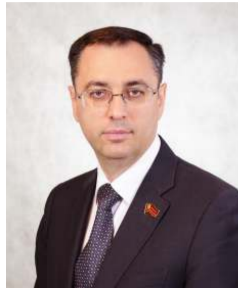
Первый секретарь Оренбургского областного комитета КПРФ Амелин М.А.