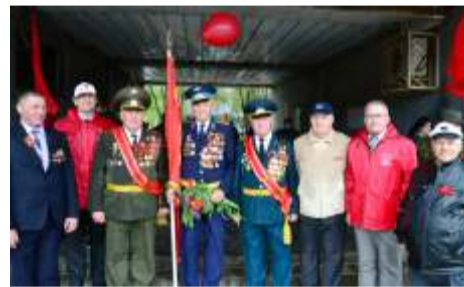
Красное знамя в крепких руках

Коммунисты Бузулука, приняли участие в возложении цветов к «Вечному огню» и последующем шествии. Возглавил колонну с красными знаменами и портретами маршалов Победы первый секретарь горкома, депутат Законода-