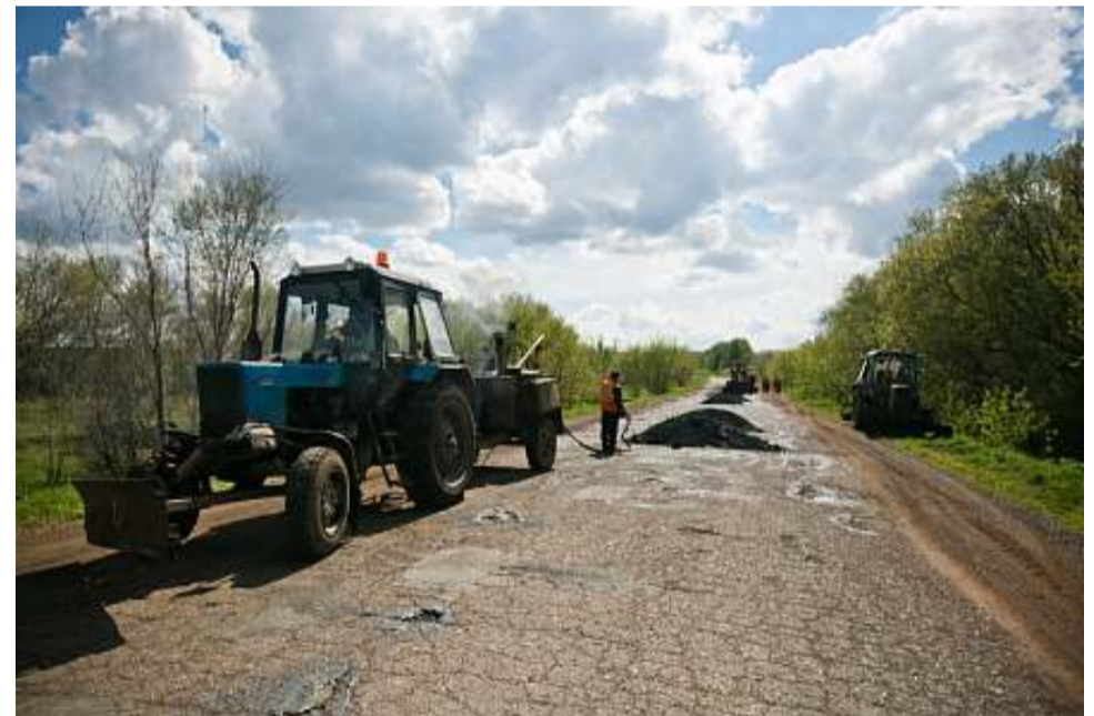
Дорога Саракташ – Бурунча – Новомихайловка.

18-тикилометровый участок трассы Саракташ - Бурунча - Новомихайловка, отремонтированный в 2016 году, этой весной стал разрушаться.