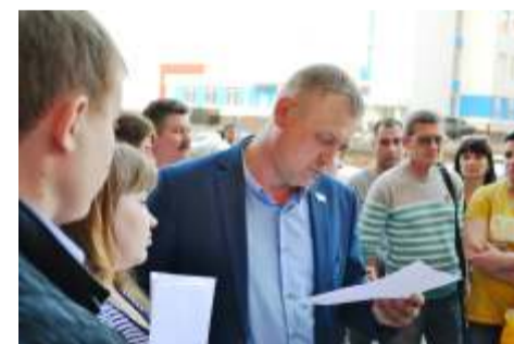
Депутат Батурин Д.Д.