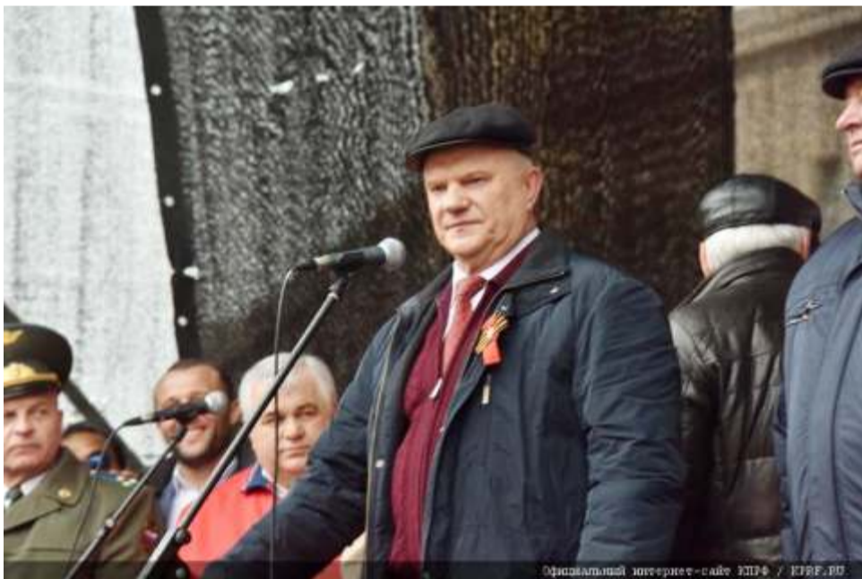
Председатель ЦК КПРФ Зюганов Г.А. поздравил со сцены участников демонстрации

Руководители КПРФ, ветераны и труженики тыла, депутаты Госдумы приняли в Москве участие в демонстрации и митинге по случаю празднования Дня Победы.