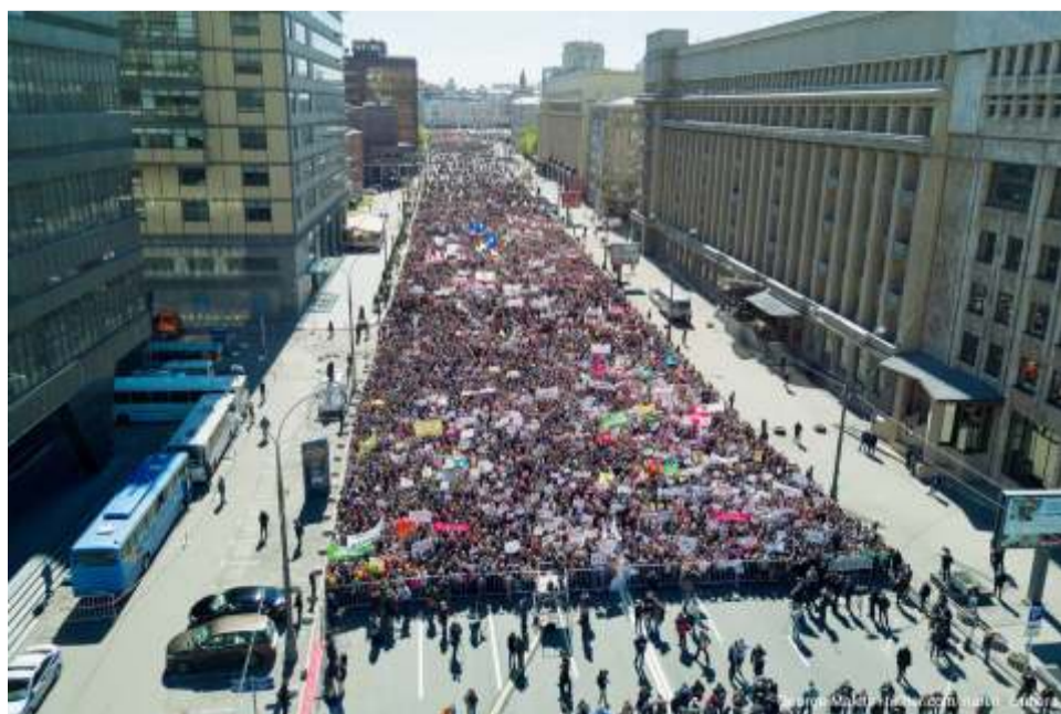
Фото митинга с воздуха.