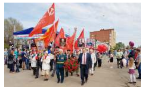
Бузулук на марше

В Орске и Кувандыке, Первомайском и Новотроицке, Тоцке и Курманаевке, во всех городах и районных центрах области в праздничных колоннах шли коммунисты, с трибун звучали их поздравления, гордо реяли знамена СССР, Победы и Партии!