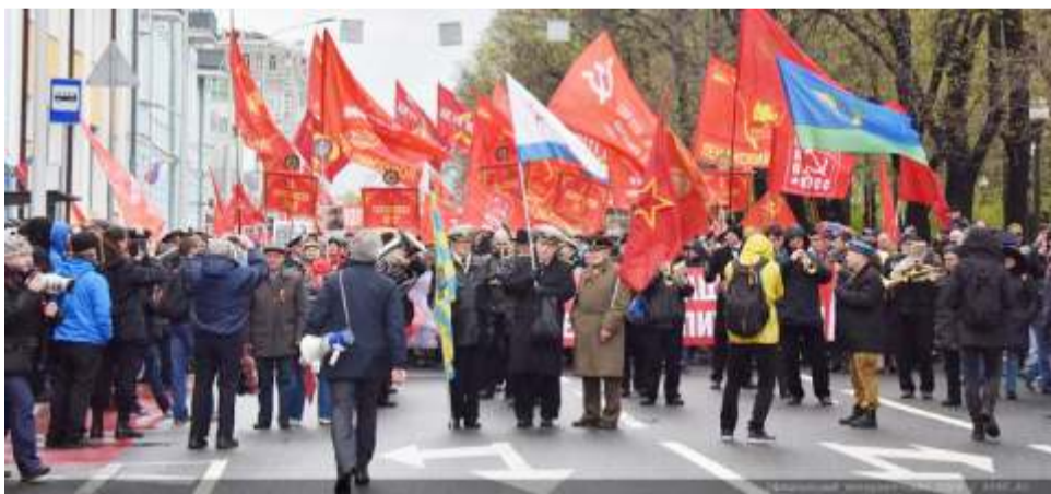
Как всегда многочисленная колонна коммунистов и сторонников

Центральный и Московский городские Комитеты Коммунистической партии Российской Федерации, Движение в поддержку Армии, Союз Советских офицеров и Всероссийское женское движение «Надежда России», Ленинский Коммунистический Союз молодежи и ряд других левых партий и движений провели демонстрацию и митинг, посвященные 72-й годовщине Победы Советского народа над фашистской Германией в Великой Отечественной войне под руководством И.В. Сталина, против развала Российской Армии и за социальную справедливость.